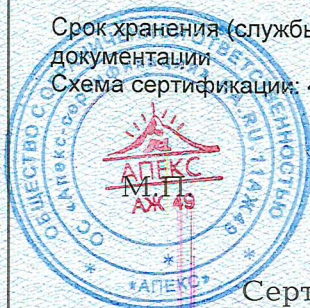
Схема сертификации: 4

Срок хранения (службы, годности) указан в прилагаемой к продукции товаросопроводительной и/или эксплуатационной документации