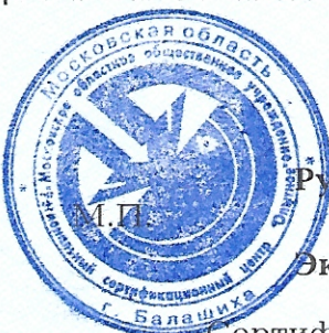
Схема сертификации №4с.