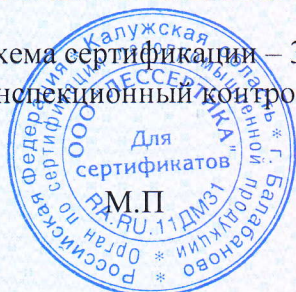
Схема сертификации – Зс. Инспекционный контроль – октябрь 2021 года, октябрь 2022 года.